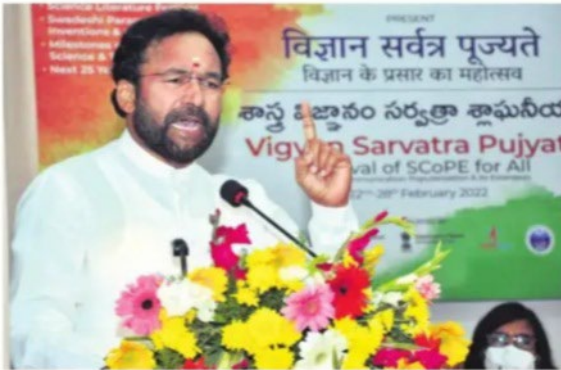
సైన్స్ సదస్సులో మాట్లాడుతున్న కిషన్ రెడ్డి

తాత్కాలిక ఫిబ్రవరి 26 (ప్రభ న్యూస్): కార్యక్రమం సాంకేతిక రంగాల్లో మన దేశం ఎంతో అభివృద్ధి చెందిందని కేంద్రమంత్రి జి. కిషన్ రెడ్డి అన్నారు. పారిశ్రామికంగా ఎంతో ముందుకు పోయిందని చెప్పారు. గతంలో మాస్కులతో సహా