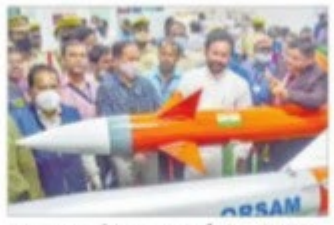
సైన్స్ ప్రదర్శనలో స్ట్రోబోస్కోపిక్ పరిశీలనను కిషన్ రెడ్డి

కేంద్ర మంత్రి కిషన్ రెడ్డి లాంఛనం (హైదరాబాద్): మన శాస్త్రవేత్తలు కడుగొచ్చి వ్యాక్సినే కాలింగానే కరోనాపై భారత విజయం సాధించగలిగిందని కేంద్ర మంత్రి కిషన్ రెడ్డి అన్నారు. ఈ విషయంలో శాస్త్రవేత్తల కృషి ఎంతో గొప్పదని, ఆదికారులు. ప్రజల సహకారం కూడా దీనికి తోడ్పడిన పేర్కొన్నారు. తారాకలోని జాతీయ పోషకాహార సంస్థ (ఎన్ఐఎన్) లో 16 ఏళ్ల సాంకేతికత వేదకులు. ఆజాద్ కా అమృత్ మహోత్సవంలో భాగంగా నిర్వహిస్తున్న సైన్స్ వారోత్సవాల కార్యక్రమంలో కనిపించిన కిషన్ రెడ్డి ముఖ్యఅతిథిగా పాల్గొన్నారు. ఈ సందర్భంగా