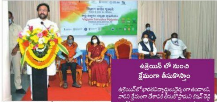
మాట్లాడుతున్న కేంద్ర మంత్రి కిషన్ రెడ్డి

బీజేపీ తెలంగాణ బ్యూరో/సికింద్రాబాద్: దేశ యువత మేధో సంపత్తి శక్తిని ప్రపంచానికి చాటి చెప్పాలని కేంద్ర మంత్రి కిషన్ రెడ్డి ఆహ్వానించారు. భవిష్యత్ అంతా సైన్స్ దేశాని, జపూటికే స్టార్టప్ ల ఏర్పాటులో భారతదేశం రెండో స్థానంలో ఉండని పేర్కొన్నారు. జాతీయ సైన్స్ వారోత్సవాల్లో భాగంగా తారాక్షత్రలోని నేషనల్ ఇన్స్టిట్యూట్ ఆఫ్ స్పేస్ సైన్స్ కమ్యూనికేషన్ పాపులరైజేషన్ అండ్ ఇట్స్ ఎక్స్ టెన్షన్ ఫర్ ఆల్ పేరుతో వేడుకలను నిర్వహించారు. ముఖ్య అతిథిగా పాల్గొన్న కేంద్రమంత్రి మాట్లాడుతూ ప్రభుత్వం తరపున శాస్త్రవేత్తలకు ప్రోత్సాహం అందించినట్లు తెలిపారు. కరోనా వ్యాక్సిన్ తయారీ పరిశ్రమలను ప్రధాని మోడీ నేరుగా పరిశీలించారని పేర్కొన్నారు. రక్షణ శాఖకు అవసరమైన ఎక్స్ ప్లెస్ టివ్ కూడా మన దేశంలోనే తయారు చేసుకుంటున్నామని వెల్లడించారు. అజాదీ కా అమృత్ మహోత్సవ లో భాగంగా ప్రతి రంగాన్ని సమీక్షిస్తున్నట్లు స్పష్టం